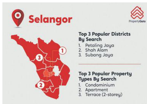
Kawasan yang menjadi tumpuan di Selangor.

Indeks Pasaran PropertyGuru mendapati, permintaan hartanah di Selangor tinggi meskipun harga menurun dengan hartanah di Petaling