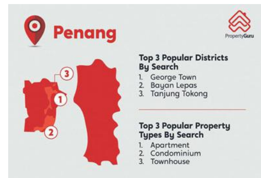
Kawasan yang menjadi tumpuan di Pulau Pinang.