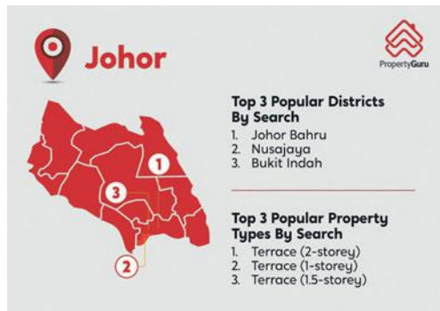
Kawasan yang menjadi tumpuan di Johor.