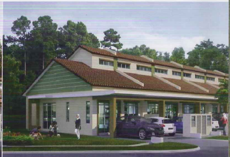
Torenia Rumah Teres 1 Tingkat 20' x 60'