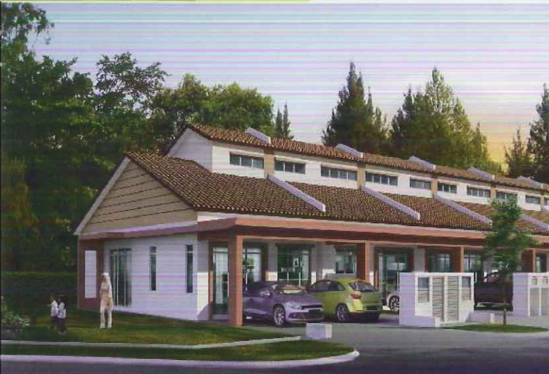
Heliconia Rumah Teres 1 Tingkat 20' x 60'