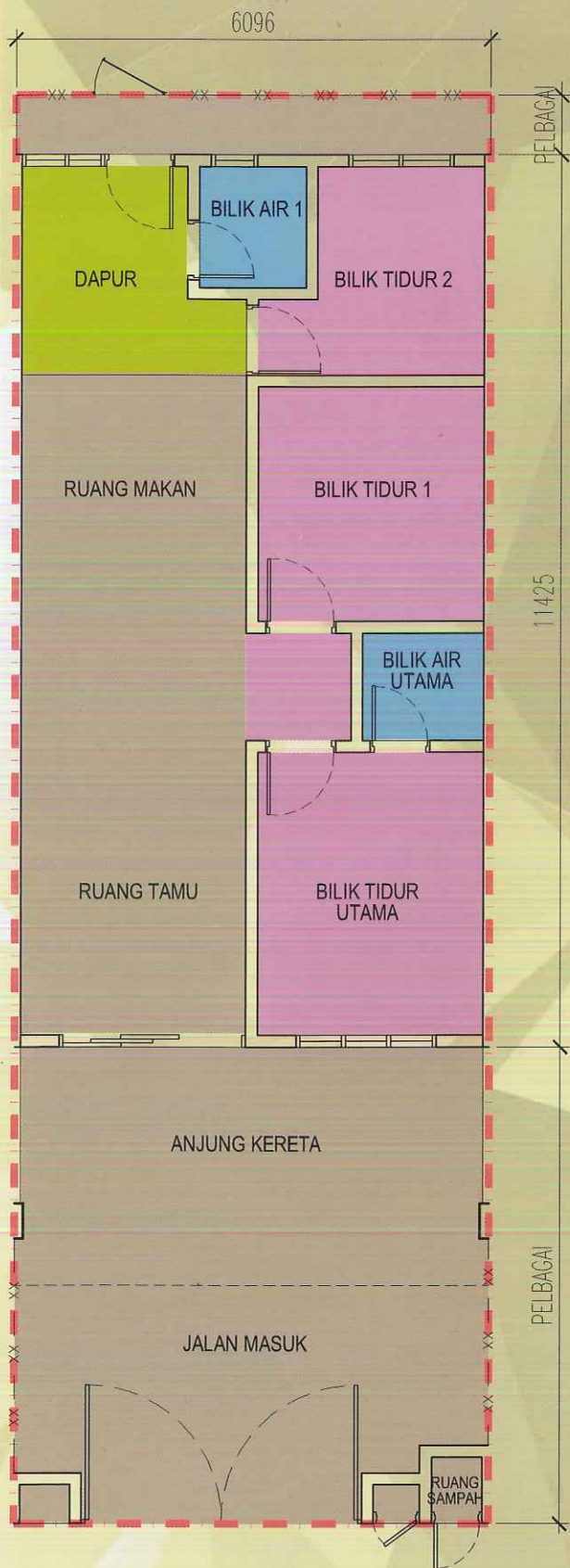
LOT TENGAH PELAN TINGKAT BAWAH