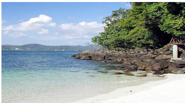
Sumber : http://www.traveltourz.com , Mei 2007

Foto 9 : Kesinambungan biodiversiti dapat dipelihara melalui perlindungan alam sekitar pulau.