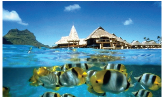
Foto 3: Panorama Pulau Redang (foto atas) dan Pulau Jerejak (foto bawah) yang menarik perhatian pelancong dan juga merupakan pulau di bawah kategori Pulau Taman Laut.

Matlamat utama penubuhan taman laut di Malaysia adalah untuk melindungi, memulihara dan mengurus secara berterusan ekosistem marin. Terumbu karang serta flora dan fauna memainkan peranan utama dalam kestabilan lautan secara keseluruhan, supaya ekosistem marin ini akan sentiasa terpelihara dari gangguan dan kerosakan untuk kepentingan generasi akan datang.