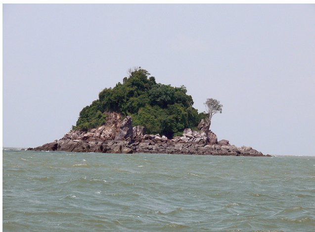
Foto 7: Pulau Angsa, Kuala Selangor merupakan salah satu contoh pulau yang tidak didiami.

Sumber : http://www.tourismselangor.com , Februari 2007