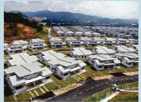
Penyelarasan semua institusi berkaitan perumahan di bawah satu bumbung dapat mengelakkan pertindihan tugas.